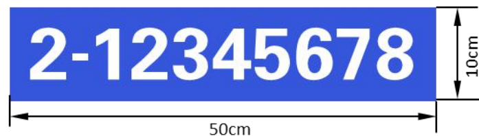
图 1 非道路移动机械环保标牌样式